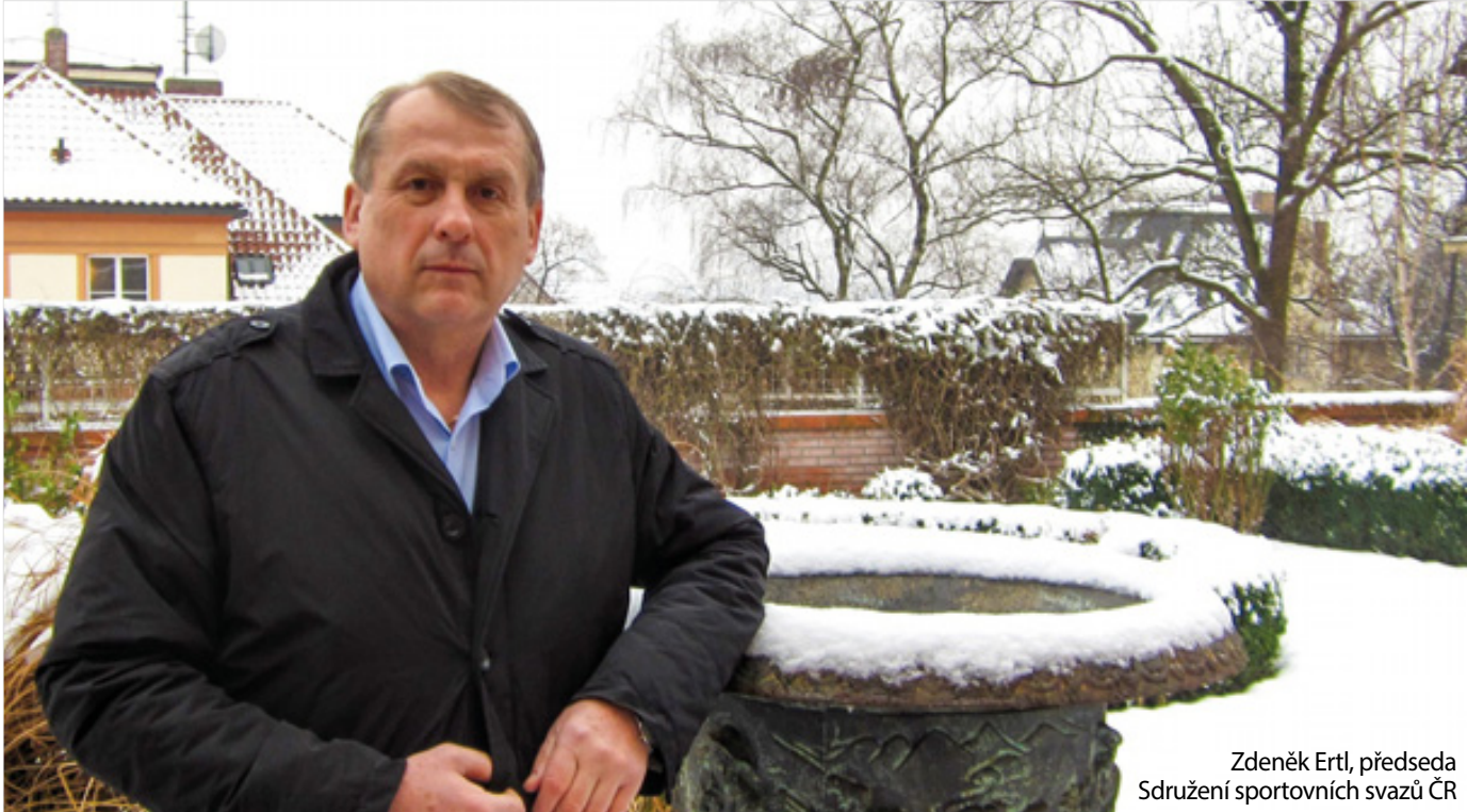
Zdeněk Ertl, předseda Sdružení sportovních svazů ČR